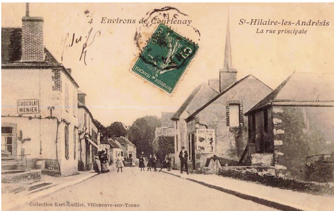
St-Hilaire-les-Andrésis La rue principale