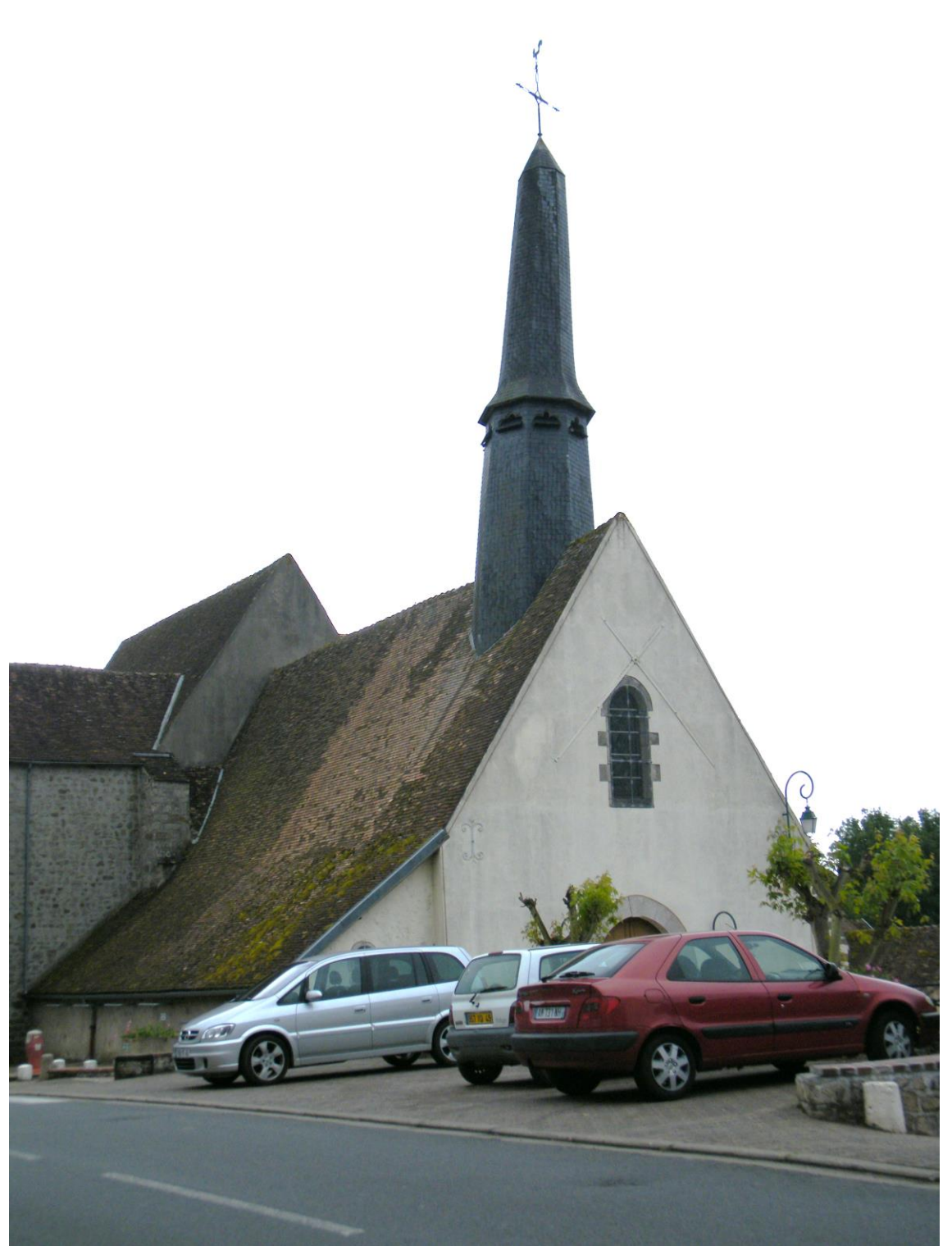
ST-HILAIRE-les-ANDRÉSIS (Loiret) — L'Eglise